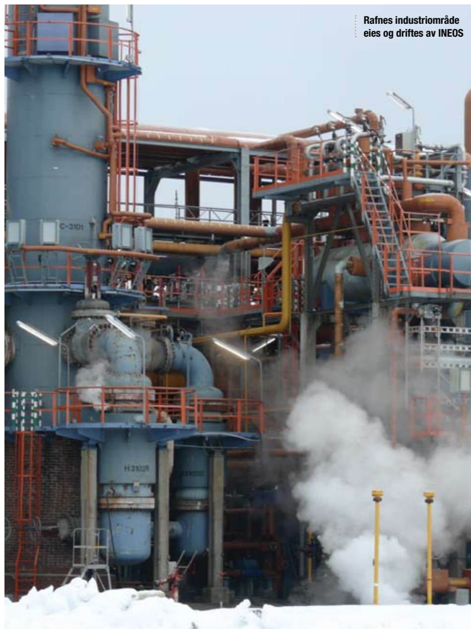
Rafnes industriområde eies og driftes av INEOS