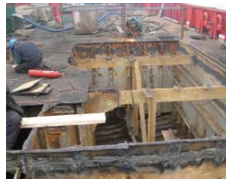
Arbeid ombord i BB Lifter i Szczecin i Polen

BB Lifter gjennomgår i disse dager en omfattende oppgradering på verksted i Polen. Dette inkluderer skifte av 40 T stål på akterdekk, ny push-baug, ballast og FW-tanker sandblåses og coats samt utbedring av ny storesrom, bysse,