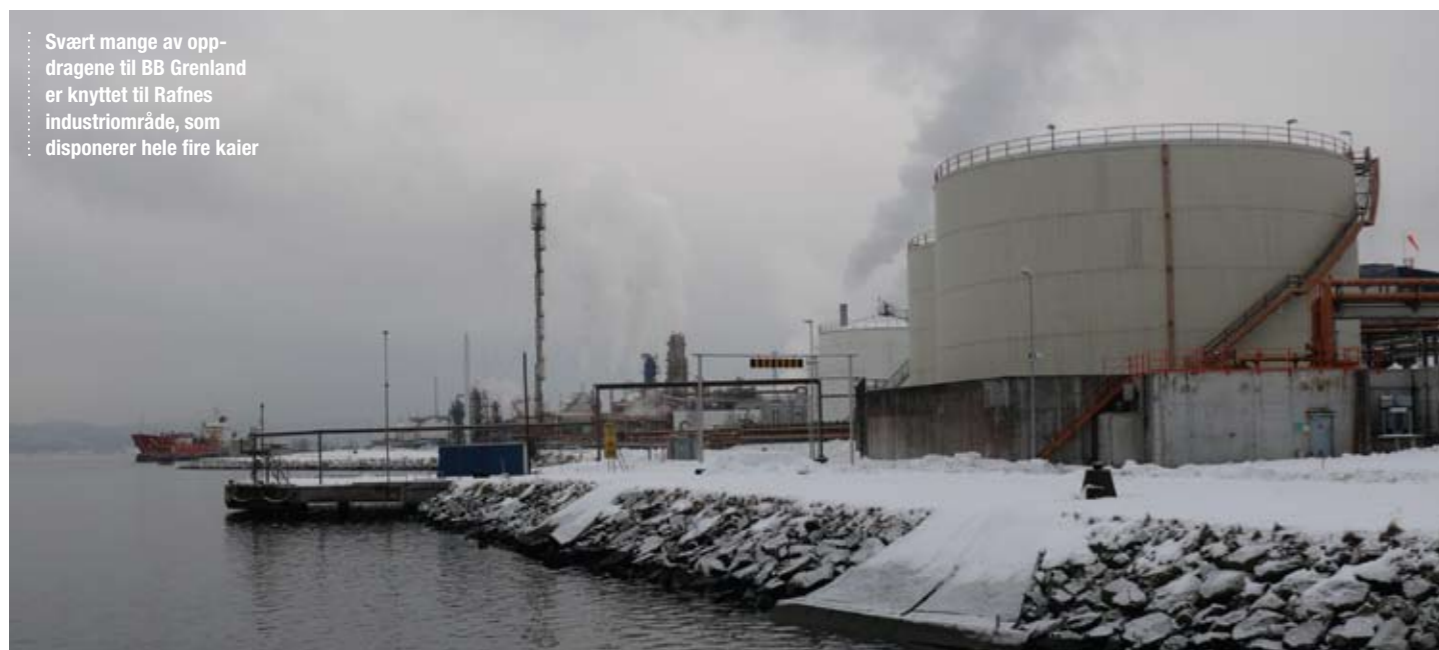
Svært mange av oppdragene til BB Grenland er knyttet til Rafnes industriområde, som disponerer hele fire kaier

520 000 tonn VCM 280 000 tonn lut 260 000 tonn klor 135 000 tonn S-PVC 30 000 tonn P-PVC 30 000 tonn saltsyre 7500 tonn hydrogen