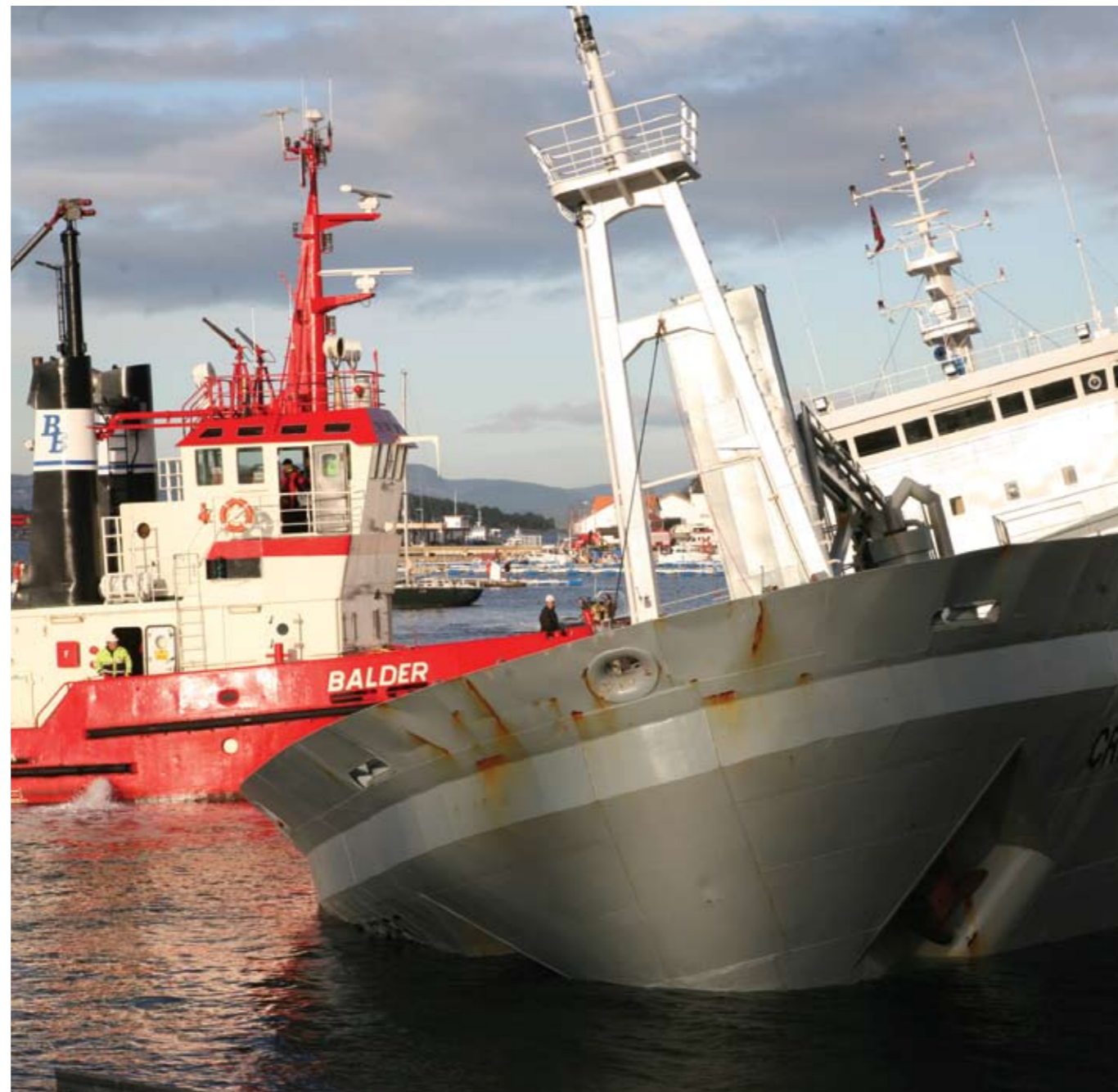
Balder i aksjon ved Crete Cement ved Fagerstrand i Oslofjorden