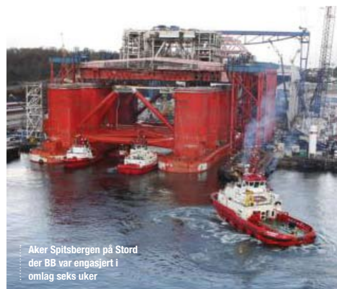
Aker Spitsbergen på Stord der BB var engasjert i omlag seks uker