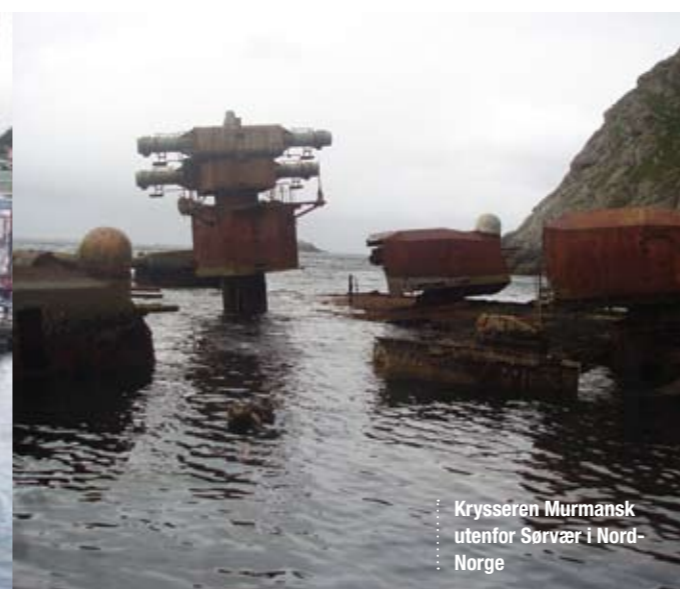
Krysseren Murmansk utenfor Sorvær i Nord-Norge